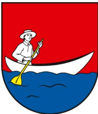
Príloha 1: erb obce